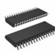
AT28LV010-25SI Microchip Technology IC EEPROM 1MBIT 250NS 32SOIC