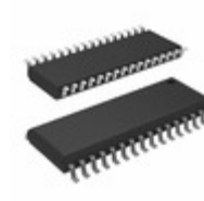
AT28LV010-25SC Microchip Technology IC EEPROM 1MBIT 250NS 32SOIC