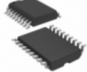
PIC16C716T-04E/SO Microchip Technology IC MCU 8BIT 3.5KB OTP 18SOIC