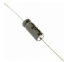
337TTA050M Illinois Capacitor AXIAL E-CAP