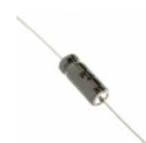
337TTA100M Illinois Capacitor CAP ALUM 330UF 20% 100V AXIAL