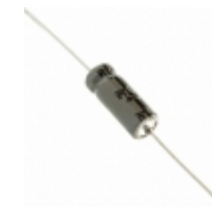
337TTA063M Illinois Capacitor CAP ALUM 330UF 20% 63V AXIAL