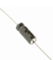
337TTA025M Illinois Capacitor CAP ALUM 330UF 20% 25V AXIAL