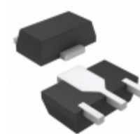
HMC453ST89ETR Analog Devices Inc. IC MMIC AMP HBT 1.6W SOT-89