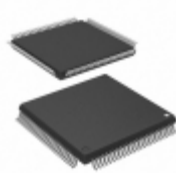
UPD78F1013GC-UEU-AX Renesas Electronics America IC MCU 16BIT 96KB FLASH 100LQFP