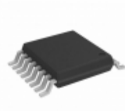
DG442LDQ-T1-E3 Electro-Films (EFI) / Vishay IC SWITCH QUAD SPST 16TSSOP