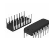
DG442LDJ-E3 Electro-Films (EFI) / Vishay IC SWITCH SPST 30 OHM 16DIP