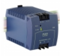
ML95.100 PULS DIN RAIL PWR SUPPLY 95W 24 3.9A