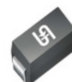
SMAJ20A M2G TSC (Taiwan Semiconductor) TVS DIODE 20V 32.4V DO214AC