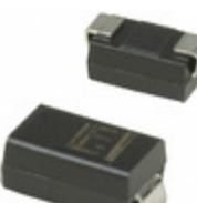
SMAJ20A Littelfuse Inc. TVS DIODE 20VWM 32.4VC SMA