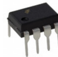
HCPL2530 AMI Semiconductor / ON Semiconductor OPTOISO 2.5KV 2CH TRANS 8DIP