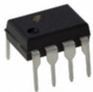
HCPL2530 Fairchild/ON Semiconductor OPTOISO 2.5KV 2CH TRANS 8DIP