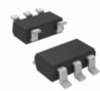
TC2186-2.85VCTTR Microchip Technology IC REG LDO 2.85V 0.15A SOT23-5