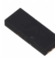
DMG5802LFX-7 Diodes Incorporated MOSFET 2N-CH 24V 6.5A 6DFN