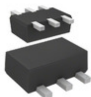
DMG564H30R Panasonic Electronic Components TRANS PREBIAS NPN/PNP SMINI6