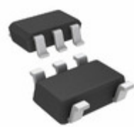
74LX1G08STR STMicroelectronics IC GATE AND 1CH 2-INP SOT-23-5