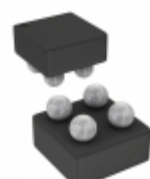
74LX1G04BJR STMicroelectronics IC INVERTER SGL 5V INP 4FLIPCHIP