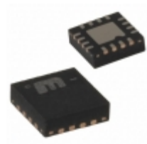
MIC68400-1.2YML-TR Microchip Technology IC REG LDO 1.2V 3A 16MLF