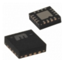
MIC68400-1.8YML-TR Microchip Technology IC REG LDO 1.8V 3A 16MLF