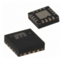
MIC68400-0.8YML TR Microchip Technology IC REG LDO 0.8V 3A 16MLF