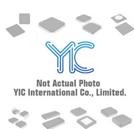
MIC68400-1.2YML MICREL MIC68400-1.2YML MICREL