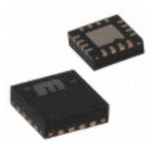
MIC68400-1.5YML TR Microchip Technology IC REG LDO 1.5V 3A 16MLF