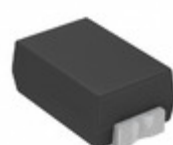
CDZT2R4.3B Rohm Semiconductor DIODE ZENER 4.3V 100MW VMN2