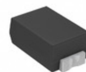
CDZT2R4.7B Rohm Semiconductor DIODE ZENER 4.7V 100MW VMN2