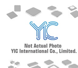
MIC5320-SFYD6 MIC MIC5320-SFYD6 MIC