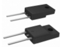
RFNL20TJ6SGC9 Rohm Semiconductor DIODE GP 600V 20A TO220ACFP