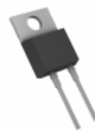
RFNL10TJ6SGC9 Rohm Semiconductor DIODE GP 600V 10A TO220ACFP