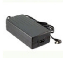
DT060AF-6 Curtis Industries AC/DC DESKTOP ADAPTER 24V 60W