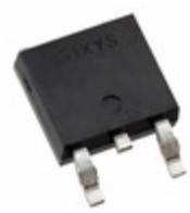
IXFY36N20X3 IXYS Corporation 200V/36A ULTRA JUNCTION X3- CLASS