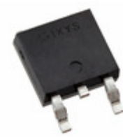
IXFY30N25X3 IXYS Corporation MOSFET N-CH 250V 30A TO252AA