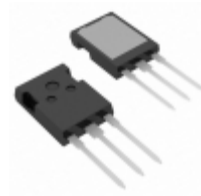
IXFX88N20Q IXYS MOSFET N-CH 200V 88A PLUS247