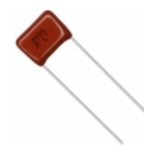
ECQ-P1H393GZ Panasonic Electronic Components CAP FILM 0.039UF 2% 50VDC RADIAL