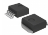
MC34167D2TR4G ON Semiconductor IC REG BUCK BOOST INV ADJ D2PAK