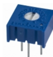
3386P-1-474LF Bourns, Inc. TRIMMER 470K OHM 0.5W PC PIN TOP