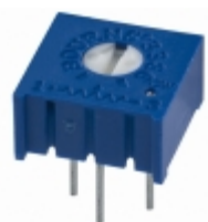
3386P-1-474 Bourns, Inc. TRIMMER 470K OHM 0.5W PC PIN TOP