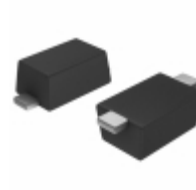
S1AFL AMI Semiconductor / ON Semiconductor DIODE GP 50V 1A SOD123F