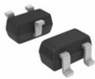
NSVBC857BTT1G ON Semiconductor TRANS PNP 45V 0.1A SC75