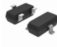
NSVBCX17LT1G ON Semiconductor TRANS PNP 45V 0.5A SOT23