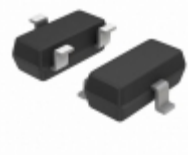
NSVBC858BLT1G ON Semiconductor TRANS PNP 30V 0.1A SOT23