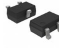
NSVBC857CWT1G ON Semiconductor TRANS PNP 45V 0.1A SOT-323