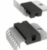
L5954 STMicroelectronics IC REG LDO MULTI OUT MULTIWATT15