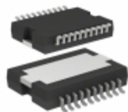
L5956PDTR STMicroelectronics IC VREG MULTIFUNCTION POWERSO20