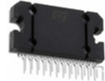
L5952 STMicroelectronics IC VREG MULTIFUNCT FLEXIWATT25