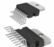
L5956 STMicroelectronics IC VREG MULTIFUNCT MULTIWATT15