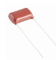
ECW-FD2W824J Panasonic Electronic Components CAP FILM 0.82UF 5% 450VDC RADIAL