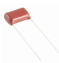
ECW-FD2W824K4 Panasonic Electronic Components CAP FILM 0.82UF 10% 450VDC RAD