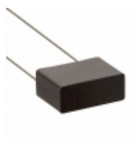
ECW-FE2J104J Panasonic Electronic Components CAP FILM 0.1UF 5% 630VDC RADIAL