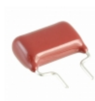
ECW-FD2W824KB Panasonic Electronic Components CAP FILM 0.82UF 10% 450VDC RAD