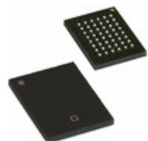
CYK256K16MCBU-70BVXI Cypress Semiconductor Corp IC PSRAM 4MBIT 70NS 48VFBGA