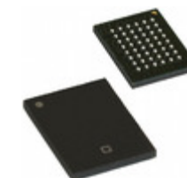
CYK256K16MCBU-70BVXIT Cypress Semiconductor Corp IC PSRAM 4MBIT 70NS 48VFBGA