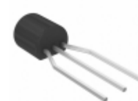
MPSA43RLRAG ON Semiconductor TRANS NPN 200V 0.5A TO-92