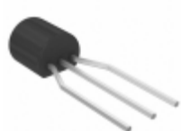
MPSA43ZL1G ON Semiconductor TRANS NPN 200V 0.5A TO-92