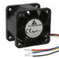
FFB0424VHN-TZT4 Delta Electronics FAN AXIAL 40X28MM 24VDC WIRE