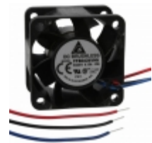
FFB0424VHN-F00 Delta Electronics FAN AXIAL 40X28MM 24VDC WIRE