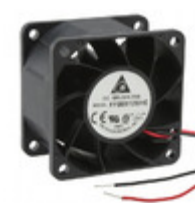
FFB0612SHE Delta Electronics FAN AXIAL 60X38MM 12VDC WIRE