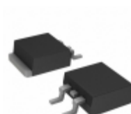
FFB05U120STM AMI Semiconductor / ON Semiconductor DIODE GEN PURP 1.2KV 5A TO263AB