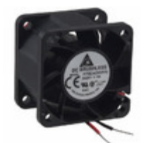
FFB0424VHN Delta Electronics FAN AXIAL 40X28MM 24VDC WIRE