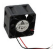
FFB0424VHN-B Delta Electronics FAN AXIAL 40X28MM 24VDC WIRE