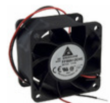
FFB0612EHE Delta Electronics FAN AXIAL 60X38MM 12VDC WIRE