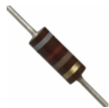
OD821JE Ohmite RES 820 OHM 1/4W 5% AXIAL