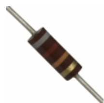
OD823JE Ohmite RES 82K OHM 1/4W 5% AXIAL