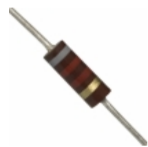
OD822JE Ohmite RES 8.2K OHM 1/4W 5% AXIAL