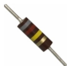
OD824JE Ohmite RES 820K OHM 1/4W 5% AXIAL