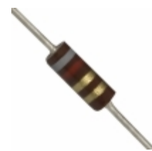
OD82GJE Ohmite RES 8.2 OHM 1/4W 5% AXIAL