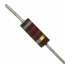
OD822J Ohmite RES 8.2K OHM 1/4W 5% AXIAL