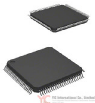
Image may be representation. See specs for product details.