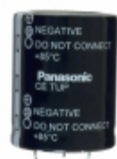
ECE-T2GP681FA Panasonic Electronic Components CAP ALUM 680UF 20% 400V SNAP