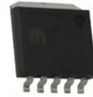
MIC37301-2.5BR TR Microchip Technology IC REG LDO 2.5V 3A SPAK-5