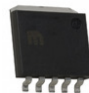
MIC37301-2.5WR Microchip Technology IC REG LDO 2.5V 3A SPAK-5