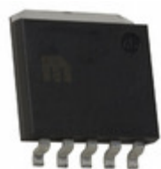
MIC37301-2.5WR-TR Microchip Technology IC REG LDO 2.5V 3A SPAK-5