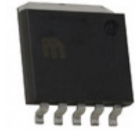
MIC37301-2.5BR Microchip Technology IC REG LDO 2.5V 3A SPAK-5