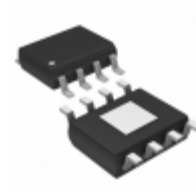
MIC37301-1.8YME Microchip Technology IC REG LDO 1.8V 3A 8SOIC