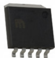
MIC37301-3.3BR Microchip Technology IC REG LDO 3.3V 3A SPAK-5