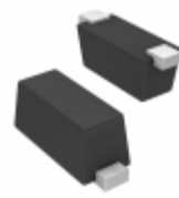
CPDQ3V3-HF Comchip Technology TVS DIODE 3.3VWM 14.1VC SOD923F