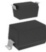
CPDH5V0U Comchip Technology TVS DIODE 5VWM 12.5VC SOD523