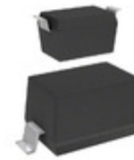
CPDH5V0U-HF Comchip Technology TVS DIODE 5VWM 12.5VC SOD523