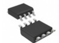
L78L33CD STMicroelectronics IC REG LDO 3.3V 0.1A 8SO