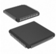
CY7C024-55JXC Cypress Semiconductor Corp IC SRAM 64KBIT 55NS 84PLCC