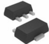
BD54FA1FP3-ZTL LAPIS Semiconductor IC REG LINEAR 5.4V 100MA SOT89-3