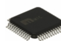
KSZ8041TL-TR Microchip Technology IC TXRX ETHERNET 48TQFP