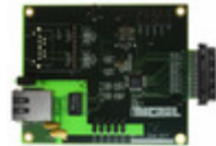
KSZ8041TL-EVAL Micrel / Microchip Technology BOARD EVALUATION KSZ8041TL