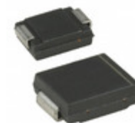
SM30T21CAY STMicroelectronics TVS DIODE 18VWM 29.2VC SMC