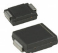
SM30T23AY STMicroelectronics TVS DIODE 20VWM 32.4VC SMC