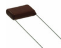
ECQ-E6124RKF Panasonic Electronic Components CAP FILM 0.12UF 10% 630VDC RAD