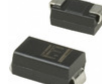
SMAJ45C Littelfuse Inc. TVS DIODE 45VWM 76.34VC SMA