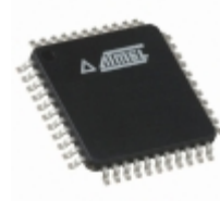
ATMEGA324P-B15AZ Microchip Technology IC MCU 8BIT 32KB FLASH 44TQFP