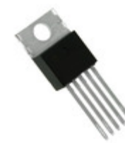
MCP1827-1202E/AT Microchip Technology IC REG LDO 1.2V 1.5A TO220-5