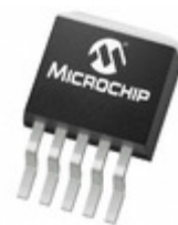
MCP1826T-5002E/ET Microchip Technology IC REG LDO 5V 1A DDPAK