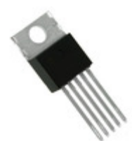
MCP1827-0802E/AT Microchip Technology IC REG LDO 0.8V 1.5A TO220-5