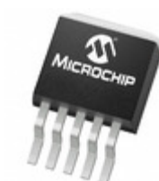
MCP1827-1202E/ET Microchip Technology IC REG LDO 1.2V 1.5A DDPAK