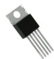
MCP1827-1802E/AT Microchip Technology IC REG LDO 1.8V 1.5A TO220-5