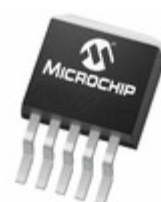
MCP1827-0802E/ET Microchip Technology IC REG LDO 0.8V 1.5A DDPAK