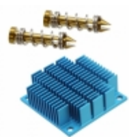
ATS-11H-98-C2-R0 Advanced Thermal Solutions, Inc. HEATSINK 45X45X15MM R-TAB T766