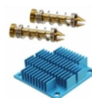
ATS-12A-01-C2-R0 Advanced Thermal Solutions, Inc. HEATSINK 40X40X10MM XCUT T766