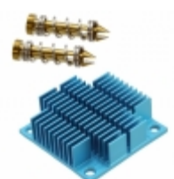
ATS-12A-02-C2-R0 Advanced Thermal Solutions, Inc. HEATSINK 40X40X12.7MM XCUT T766