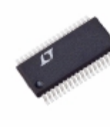
LTC4245CG#PBF Linear Technology IC CNTRLR HOT SWAP 36-SSOP