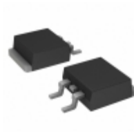
VS-HFA16TA60CSTRLP Electro-Films (EFI) / Vishay DIODE ARRAY GP 600V 8A D2PAK