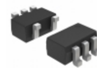
NS5B1G384DFT1G ON Semiconductor IC ANLG SWITCH SPST NC SC-70-5