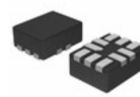
NS5A4684SMNTBG ON Semiconductor IC ANLG SWITCH DUAL SPDT 10WQFN