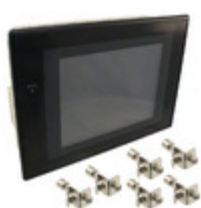
NS5-TQ10B-V2 Omron Automation & Safety HMI TOUCHSCREEN 5.7" COLOR