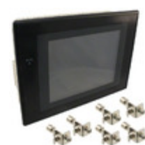
NS5-TQ11B-V2 Omron Automation & Safety HMI TOUCHSCREEN 5.7" COLOR