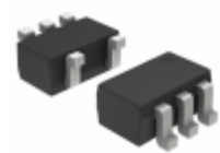
NS5B1G384DFT2G ON Semiconductor IC ANLG SWITCH SPST NC SC-70-5