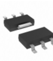
MCP1804T-5002I/DB Microchip Technology IC REG LDO 5V 0.15A SOT223-3