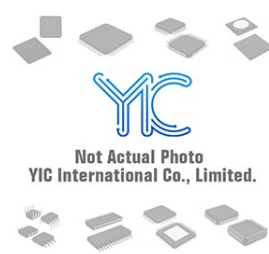
TC1017-2.85VCTTR MICROCHIP MICROCHIP SOT23-5