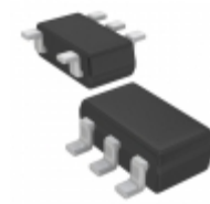
TC1017-2.85VLTTR Microchip Technology IC REG LDO 2.85V 0.15A SC70-5