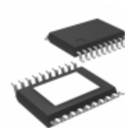
MIC2596-1BTSE-TR Microchip Technology IC SWITCH HOT SWAP DUAL 20- TSSOP