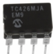
TC426MJA Microchip Technology IC MOSFET DVR 1.5A DUAL HS 8CDIP